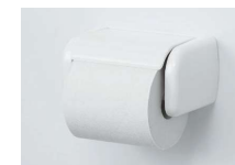
ワンタッチ式紙巻器 ワンタッチカミマキKT BW1