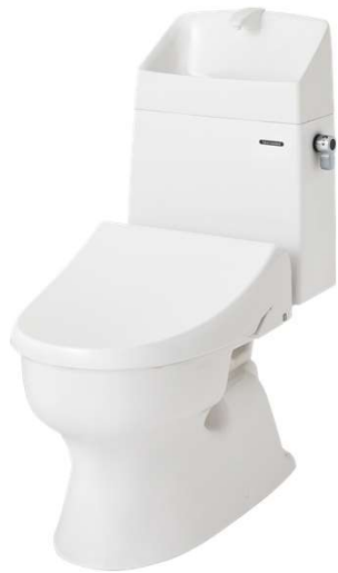
温水洗浄便座タイプ